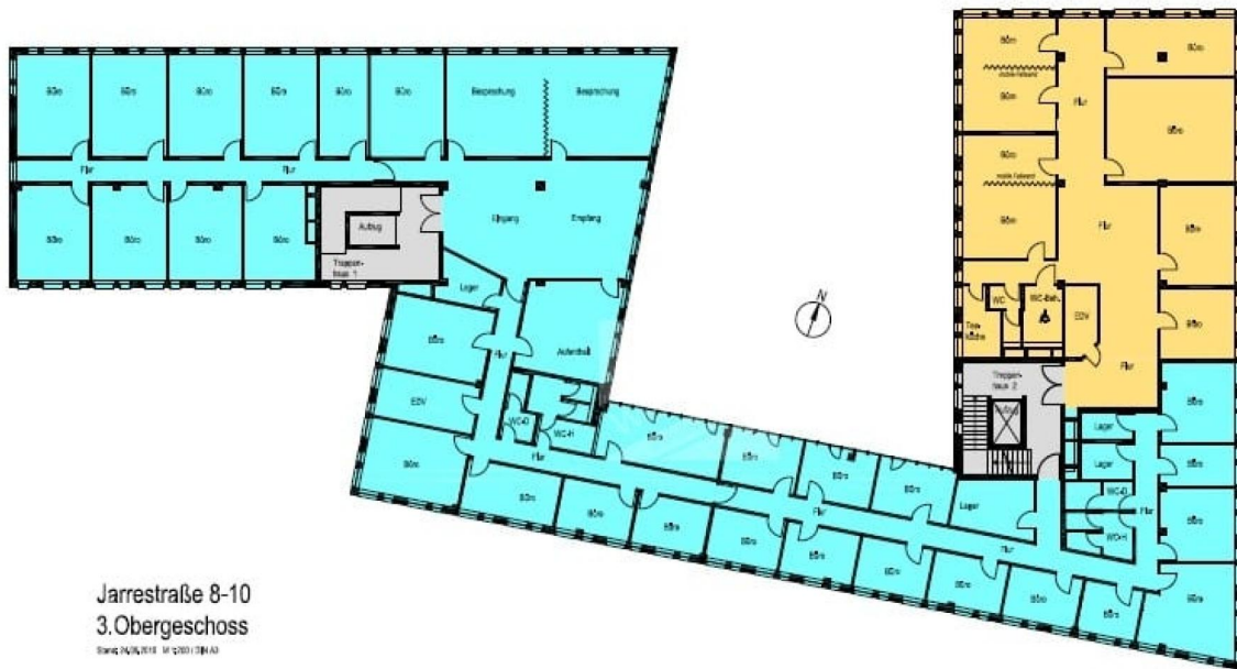
Jarrestraße 8-10 3.Obergeschoss Bauplan-Nr. 1/11 (1:200) (3/11)