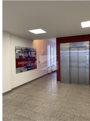
Eingangsbereich mit Personenaufzug