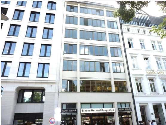
Gebäudeansicht - Kopie