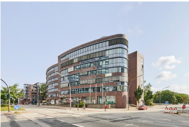
Gebäude von der Straßenseite