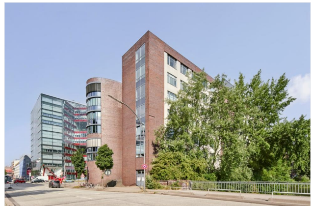
Vermarktungsfoto __Foto außen_3