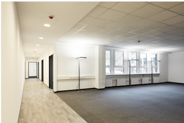
Flur mit Großraumbüro