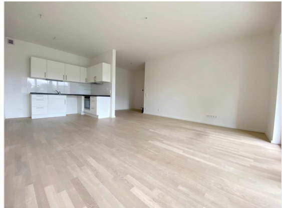
Beispiel Wohn- und Essbereich