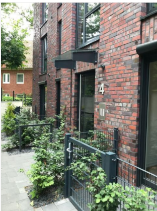
Hauseingang Nr. 4