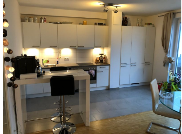
Einbauküche Ansicht 2