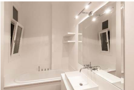
Vollbad mit Fenster Ansicht 2