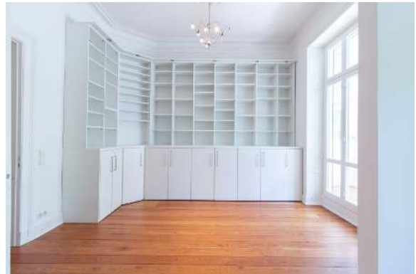
Schlaf- und Ankleidezimmer Ansicht 3