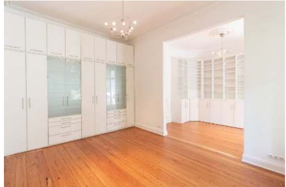
Schlaf- und Ankleidezimmer