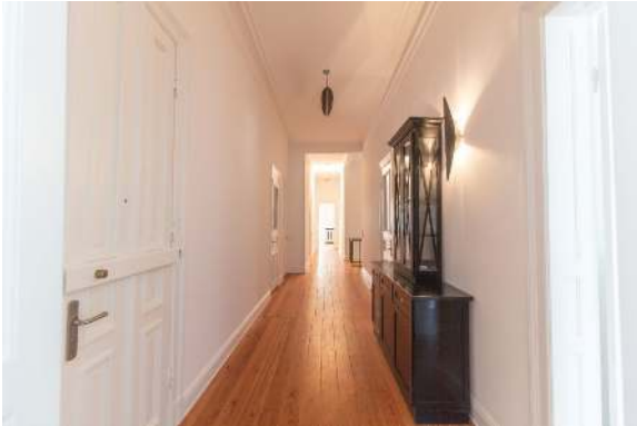
Flur im Obergeschoss