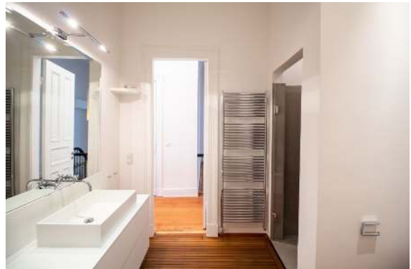
Vollbad Ansicht 1