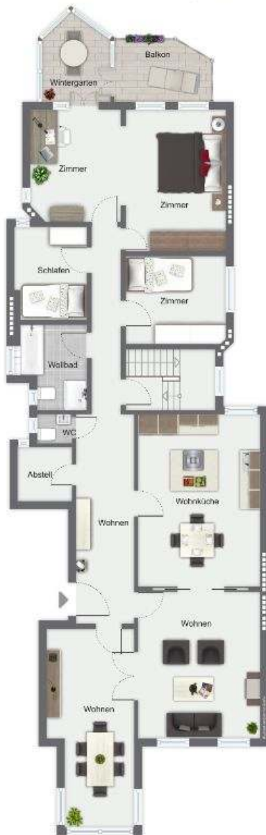
Schwanenwik 36 - Hochparterre