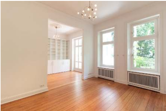
Schlafzimmer Ansicht 2